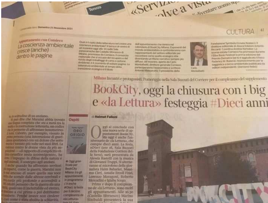
Corriere della Sera | Terza Pagina – Cultura, 21 novembre 2021 Presentazione del Premio Demetra 2022 (Comieco) nell'ambito di EBF8 al Book City Milano