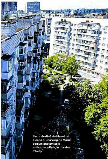
Il murale di «Saint Javelins», fionca di una Vergine Maria con un fioncissimo anticarico, a Kyiv, in Ucraina

Exòrma, Marcos y Marcos e altri. Sono 28 le case editrici presenti con titoli e incontri