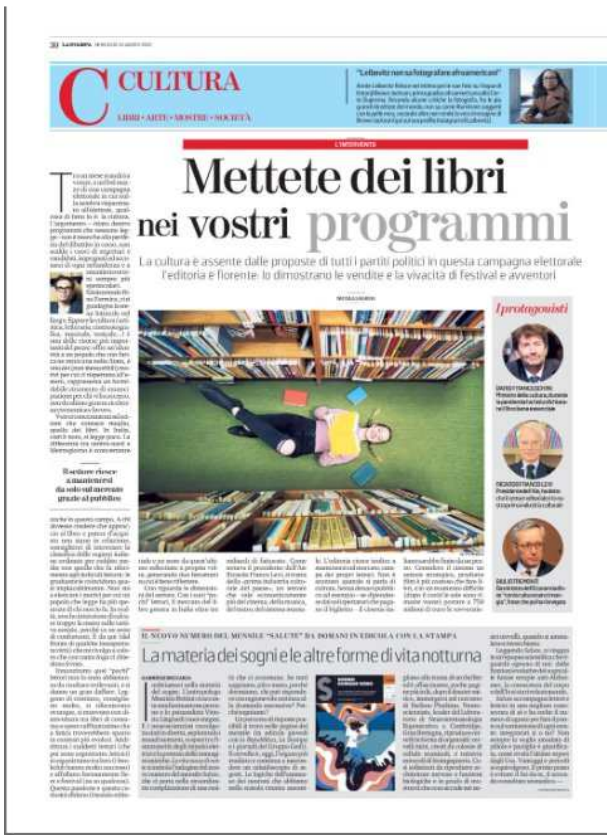
La Stampa | Cultura, 20 novembre 2021 Nell'articolo viene citato anche Elba Book Festival come esempio virtuoso di piccolo festival capace di generare economia culturale