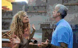
Loredana Lipperini sarà intervistata dagli studenti del Foresi che hanno seguito i laboratori di scrittura

Elba Book Festival ha avviato un progetto con il Liceo Raffaele Foresi di Portoferraio conducendo un laboratorio di scrittura creativa con le classi 3A Scientifico e 4B Scienze Umane, per condurre con i ragazzi un percorso di conoscenza e recupero di miti e leggende legate all'Isola d'Elba. Francesca Barocci, editore Galucci e membro dello staff di Elba, ha partecipato agli incontri collaborando a stretto contatto con i ragazzi e i docenti. «Dopo l'esperienza positiva dell'anno scorso, dove abbiamo mostrato ai ragazzi cosa ci fosse dietro all'organizzazione di un evento come il nostro, quest'anno ci abbiamo basati sui libri di esperimento. Il punto di partenza è stata la lettura del li-