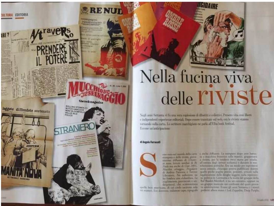
Left | settimanale, 15 luglio 2022